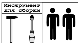
Схема сборки шкафа I-65